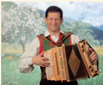
Moderation: Franz Posch