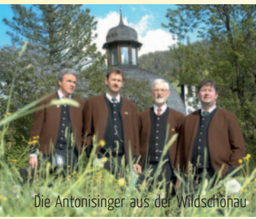
Die Antonisinger aus der Wildschönau

Vielen Dank für die freundliche Unterstützung.